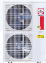
Model : CCS-32IVSA60(A)-H