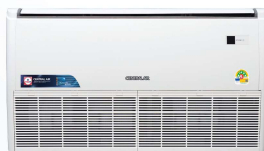
Model : CFH-32IVSA24, 30