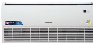
Model : CFH-32IVSA36, 36(A), 42, 48, 60