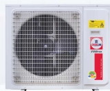
Model : CCS-32IVSA36(A)-H, 42(A)-H, 48(A)-H