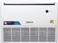
Model : CFH-32IVSA12, 18