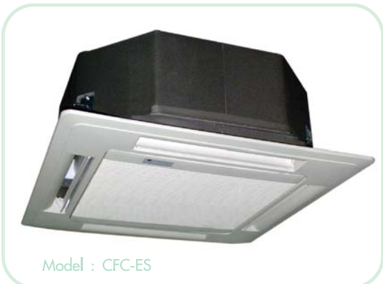
Model : CFC-ES

( ข้อมูลเฉพาะอาจมีการเปลี่ยนแปลงได้โดยไม่ต้องแจ้งให้ทราบล่วงหน้า )