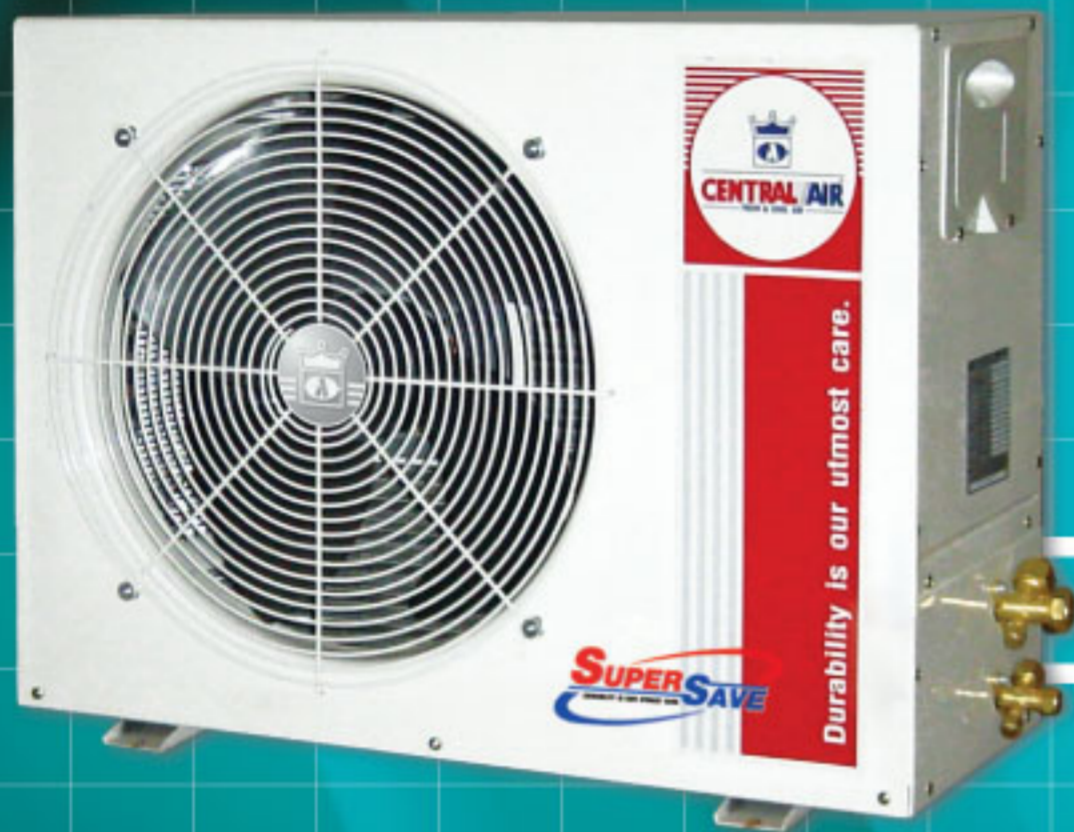
Model : CCS-ML 18