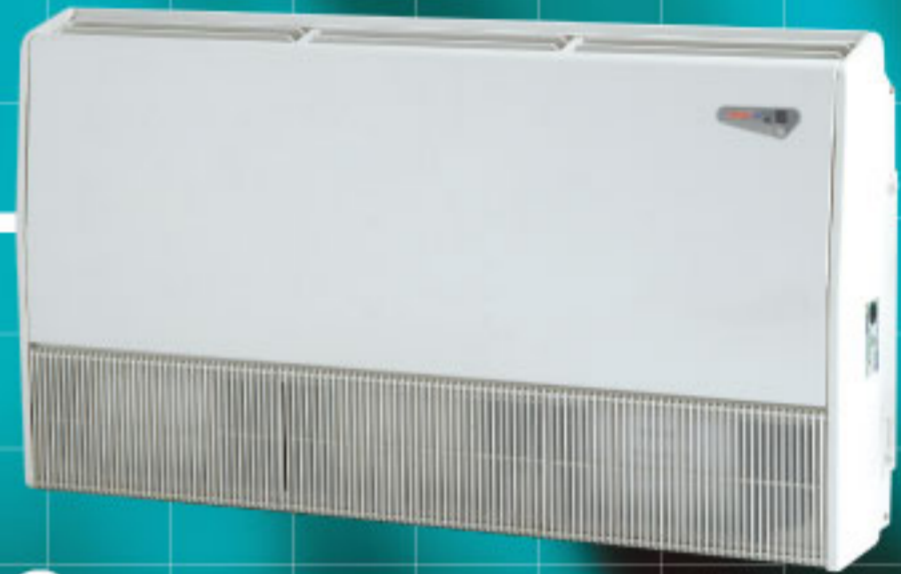
Model : CFH-G 09-12