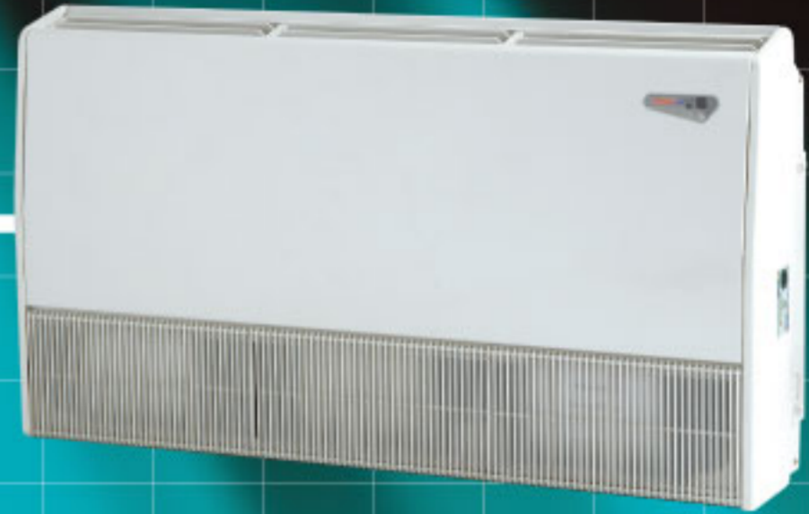
Model : CFH-G 09-12